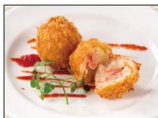
駿河湾産桜えびと 北海道産ポテトのコロッケ* 270 円 (税込 292 円)

程よい弾力感のある水わらびもちや宇治抹茶のゼリー、よもぎ風味のアイスなどをトッピングした、和が盛りだくさんで女性におすすめのパフェです。