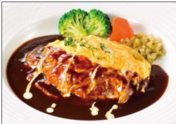
とろとろ卵のハンバーグ*

オリーブハウスで人気のハンバーグが、期間限定でとろとろ卵をのせて装い新たに登場します。また、静岡県駿河湾産桜えびや季節野菜を使用した料理、宇治抹茶味、水わらびもちの和スイーツなど季節感のあるメニューを提供いたします。