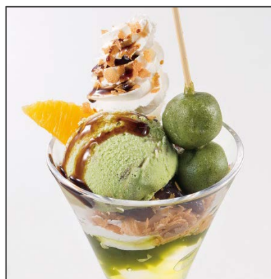
水わらびもちと草もち風アイスの和風パフェ

オリーブペースト入りガーリックソースで仕上げたスパゲティ。たっぷりのアスパラガス、たけのこを加え、厚切りベーコンで味を引き締めました。