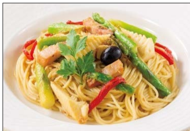
季節野菜のスパゲティ オリーブソース*

各種香辛料を加えスパイシーに仕上げたカリーソースに、駿河湾産桜えび、アボカド、たけのこなど季節を感じる具材で彩りを添えました。