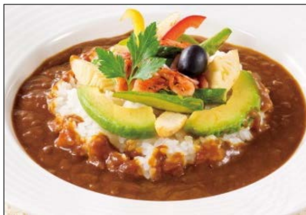
アボカド・桜えび・季節野菜のカリー*

オリーブハウス一押し、ジューシーなビーフ 100%のハンバーグに、とろとろ卵をのせました。肉の旨みがたっぷりのデミグラスソースでお召し上がりください。