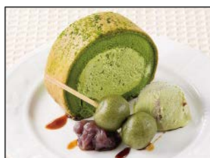
宇治抹茶のロールケーキ 550 円 (税込 594 円)