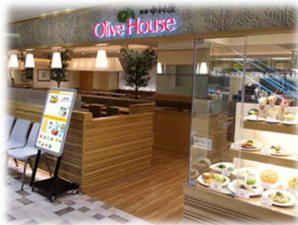
「オリーブハウス」 店舗外観

「木漏れ日のなかのテラス」をイメージしたカジュアルで明るい店内。新宿中村屋名物のインドカレーをはじめ、パスタやグラタンなどのお洒落な料理、豊富なデザートを取り揃えています。