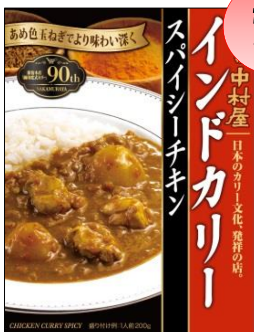
〈レギュラーサイズ〉