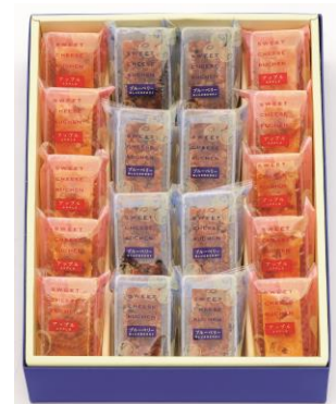
《スイートチーズクーヘン 18コ入》