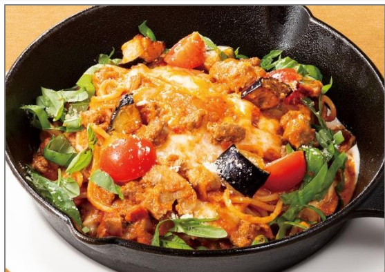
[New] モッツァレラチーズと ごろごろミートソースのスパゲティ フレッシュバジル添え 1,200円 (税込 1,296円)

肉粒感たっぷりのミートクリームソースにイタリア産モッツァレラチーズを贅沢に加えたチーズ好きにはたまらないスパゲティです。チーズと香り高いバジルを麺と絡めて食べるのがおすすめです。