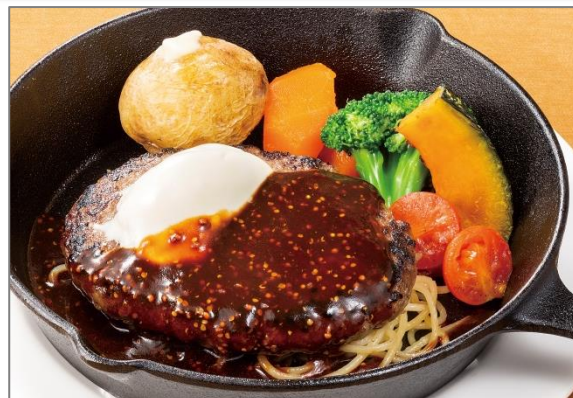
[New] マスカルポーネと ブラウンソースのハンバーグ マスタード風味 1,290円 (税込 1,394円)

肉粒感たっぷりのミートクリームソースにイタリア産モッツァレラチーズを贅沢に加えたチーズ好きにはたまらないスパゲティです。チーズと香り高いバジルを麺と絡めて食べるのがおすすめです。