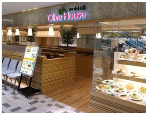
「オリーブハウス」 店舗外観

「木漏れ日のなかのテラス」をイメージしたカジュアルで明るい店内。新宿中村屋名物のインドカレーをはじめ、パスタやグラタンなどのお洒落な料理、豊富なデザートを取り揃えています。