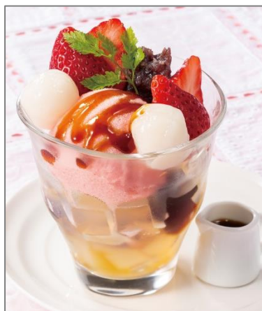
[New] 苺あんみつ 620円 (税込 670円)

人気のあるみつの苺バージョンです。寒天、黒糖ゼリー、苺シャーベット、あずき、白玉、苺を和風のグラスに盛り黒蜜を添えました。