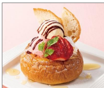
[New] 苺のハニーブレッド 530円 (税込 573円)

濃厚なチョコレートソースが中から溶け出すショコラケーキです。甘酸っぱい苺、バニラアイスと一緒に楽しみください。ティータイムにもおすすめです。