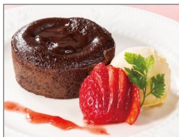
[New] 苺と フォンダンショコラ 550円 (税込 594円)

人気のあるみつの苺バージョンです。寒天、黒糖ゼリー、苺シャーベット、あずき、白玉、苺を和風のグラスに盛り黒蜜を添えました。