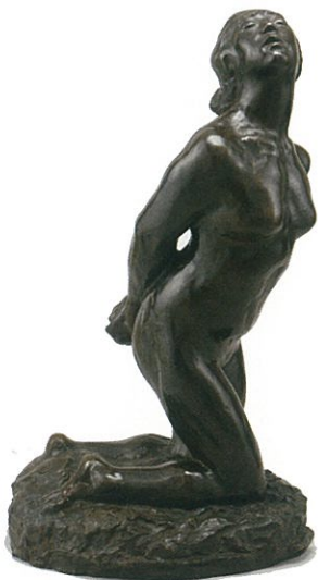
荻原守衛(碓山)作 《女》

新宿(8:00)=大王わさび農場(昼食・買い物・見学)= ==安曇野着 穂高神社参拝(解説付)==碓山美術館(ミニレクチャー・見学)=現ご当主のご案内による碓山の墓参(希望者)=新宿(20:00 予定)